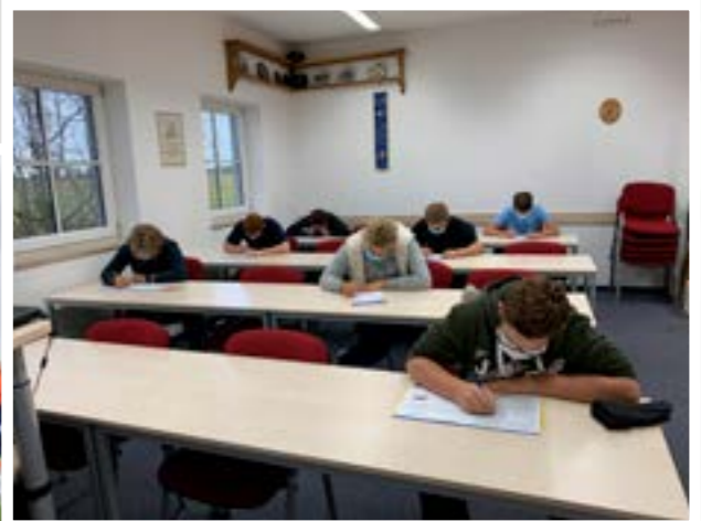
Bilder stammen aus dem Sommer; Symbolfoto: ©Vlad Chorniy/stock.adobe.com