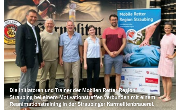
Die Initiatoren und Trainer der Mobilten Retter Region Straubing bei einem Motivationstreffen verbunden mit einem Reanimationstraining in der Straubinger Karmelitenbrauerei.